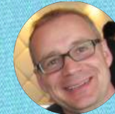
Norman Faltus Cruise Touristic Group - Unternehmensberater Kreuzfahrt